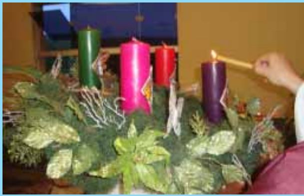
Abertura da Novena de Natal, com a Rede de Comunidades