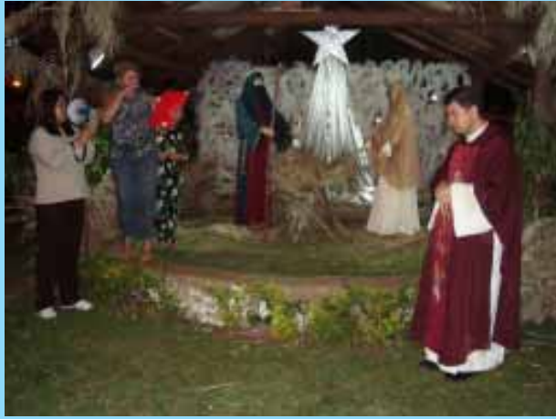
Benção do Presépio e Coroa do Advento