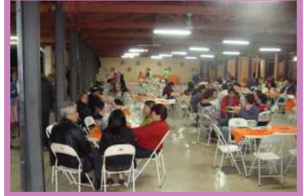
Tarde da solidariedade, espiritualidade e confraternização na doação das 35 cestas básicas às famílias necessitadas de nossa paróquia.