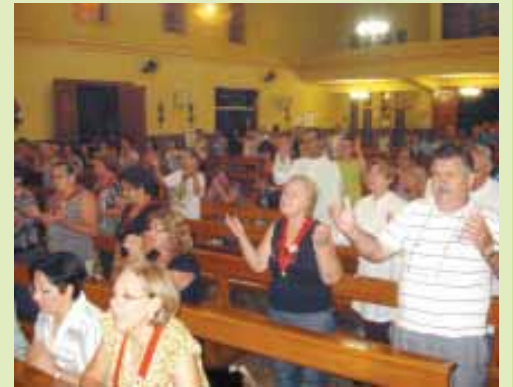
Celebração Eucarística em louvor a São Pe Pio