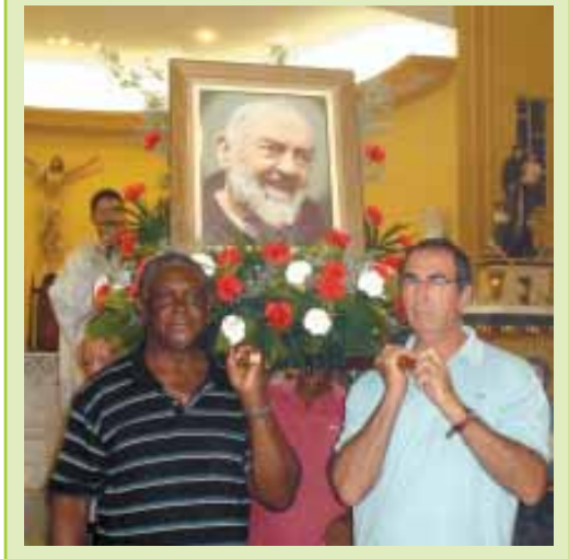
Tarde festiva em pró da Casa da criança Nino Pacheco