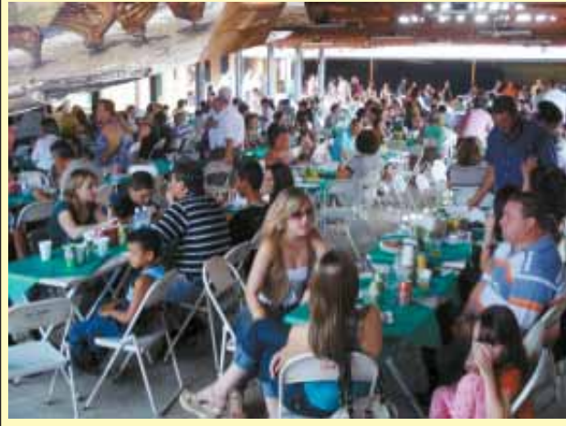
Primeiro "Costelão de Ouro"