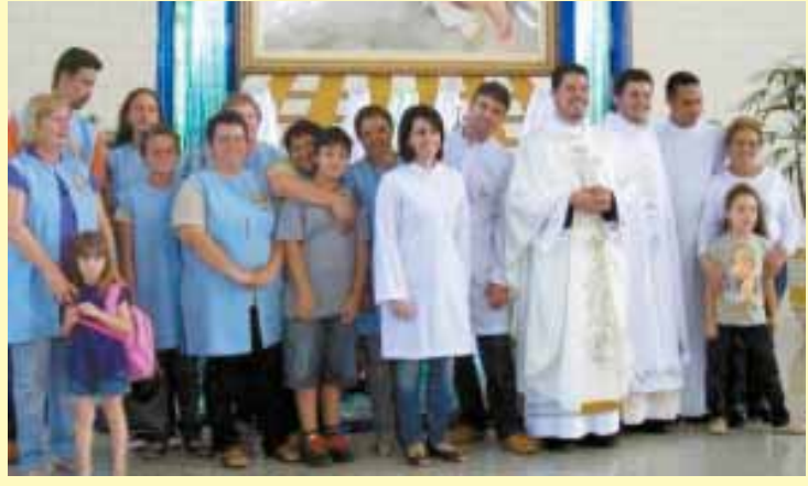
Peregrinação ao Santuário da Mãe Rainha em Atibaia