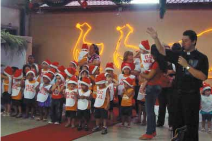
Natal da Casa da Criança e Berçário