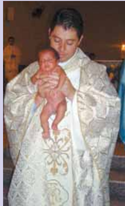
Natal paroquial com a presença das pastorais